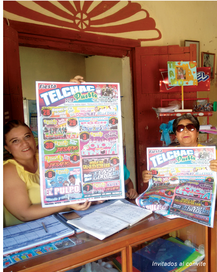
Invitados al convite