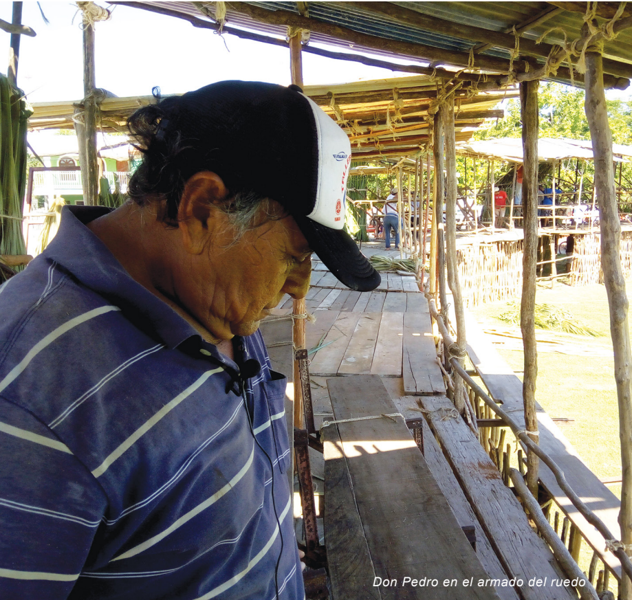
Don Pedro en el armado del ruedo