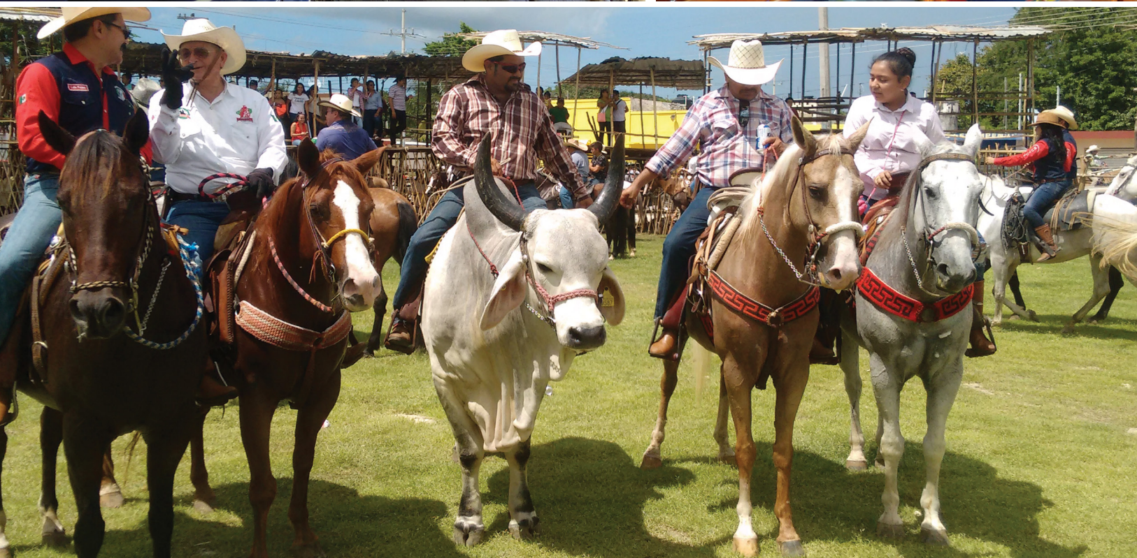
La llegada de la cabalgata y el convite al ruedo