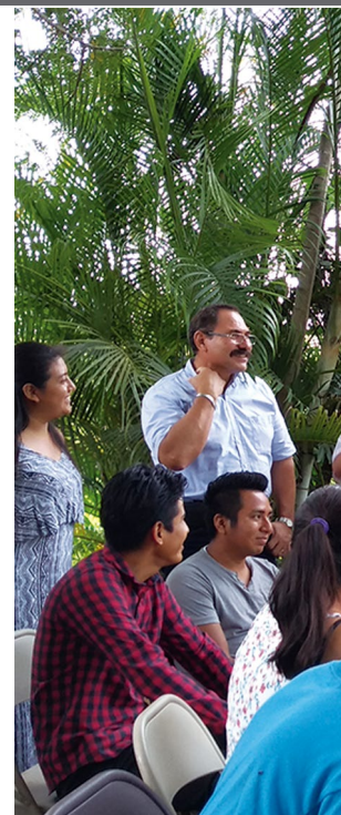
En charla de sensibilización con los estudiantes y sus familiares