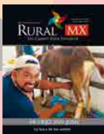
Portada Junio

Facebook: Rural MX Twitter: @Rural_MX Instagram: @rural_mx Web: www.ruraltv.com.mx Email: revistaruralmx@gmail.com Oficinas: (999) 924-74-04 Ventas: alanisyucatan_rural@hotmail.com