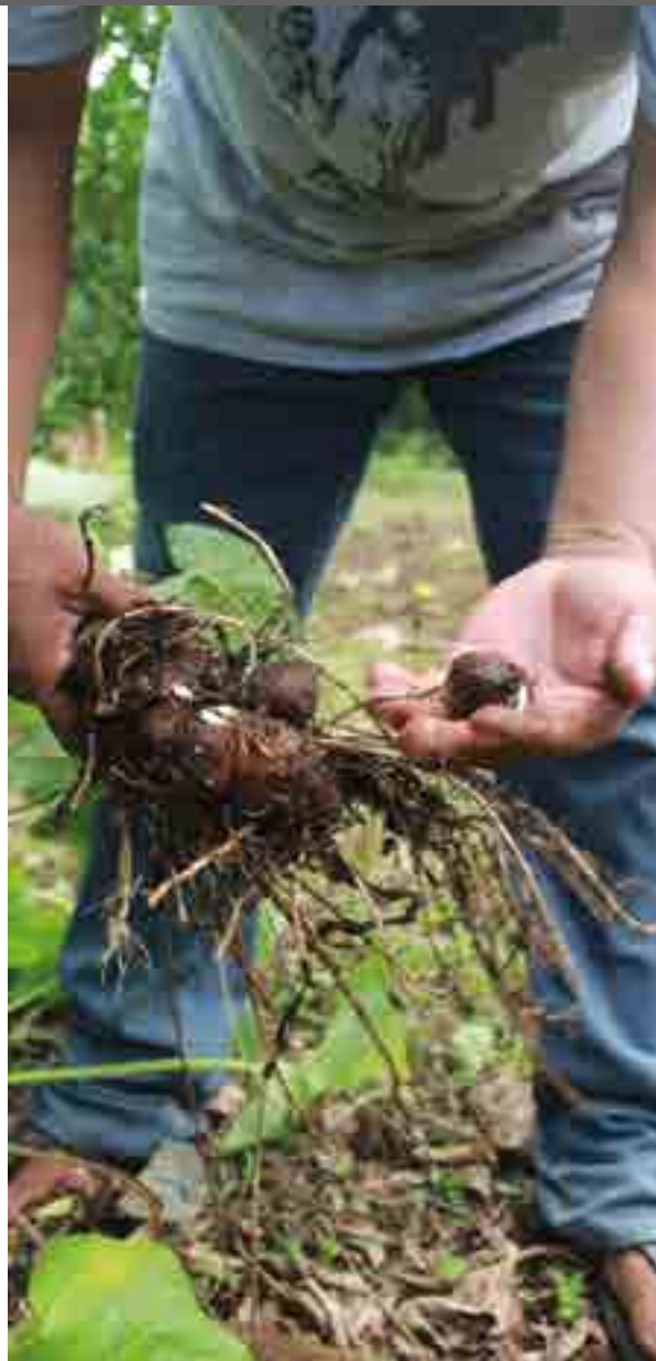
Especial Rural MX