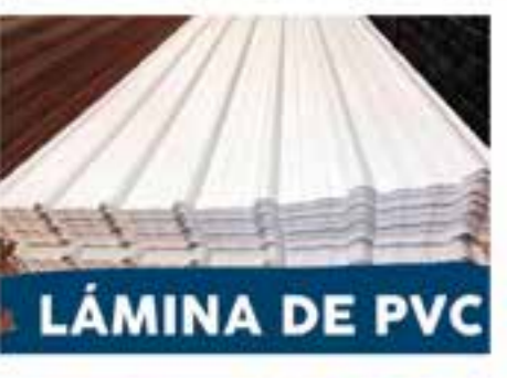
LÁMINA DE PVC