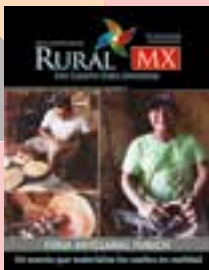
Portada Julio

El filósofo Cicerón elogiaba la vida campestre, hablaba de los deleites de los agricultores, y se emparentaba con su plenitud a la hora de producir los alimentos de los seres humanos y animales. Cicerón amaba la vida que se desarrollaba lejos de la ciudad, allí donde los labradores hacen posible la vianda, noble labor que debería ser emulada por casi todas las personas. Sin embargo, aquí lo hemos consignado; el campo envejece, aleja a los más jóvenes, a las fuerzas de relevo que no sienten ese cariño por hacer posible el alimento.