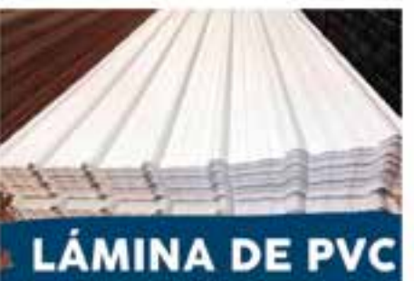
LÁMINA DE PVC